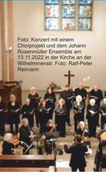
Foto: Konzert mit einem Chorprojekt und dem Johann Rosenmüller Ensemble am 13.11.2022 in der Kirche an der Wilhelminenstr.