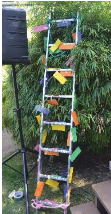
Bild: Open-Air 2022 Die Himmelsleiter