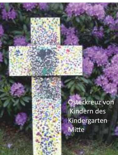
Osterkreuz von Kindern des Kindergarten Mitte