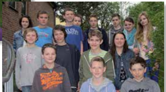
späte Gruppe ab 17.30 Uhr