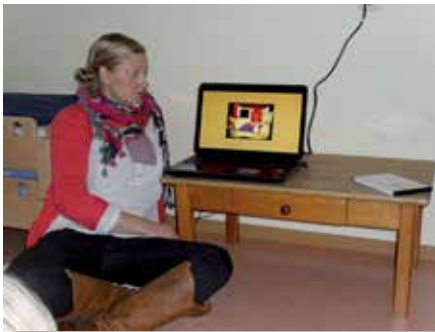
Würzburger Trainingsprogramm zur phonologischen Bewusstheit

„Würzburger Trainingsprogramm zur phonologischen Bewusstheit“ zu spielen. Dies ist ein Computerprogramm mit dem niedlichen Hamster Hanno. Er führt die Kinder spielerisch an den Schriftspracherwerb