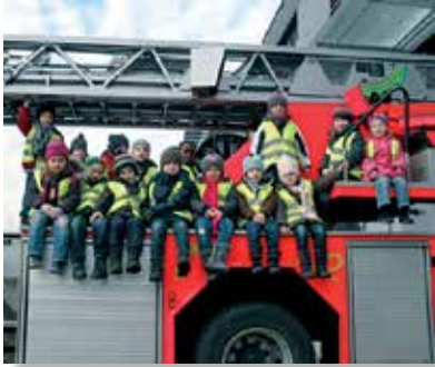
Besuch bei der Feuerwache Mülheim

In diesem Jahr haben wir neun Wilde Hummeln in unserer Einrichtung. Eine Wilde Hummel zu sein ist aufregend. Es ist das letzte Kindergartenjahr für die Kinder. In diesem Jahr erleben sie noch einmal eine Menge spannender Dinge.