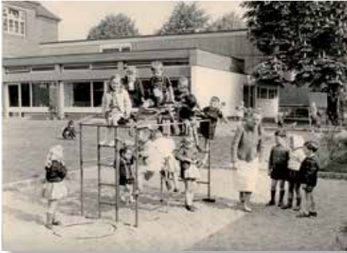
Das Foto stammt aus den 60er Jahren

Wir feiern am Sonntag, den 23. Juni 2013 das 50-jährige Bestehen unseres Kindergartens und laden Sie recht herzlich ein mit uns zu feiern, mit allem was zu einem runden Geburtstag dazu gehört: