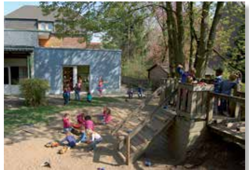
Der Kindergarten nach der Erweiterung 2011

Und natürlich ein Wiedersehen mit vielen alten Freunden Wir freuen uns auf Sie!