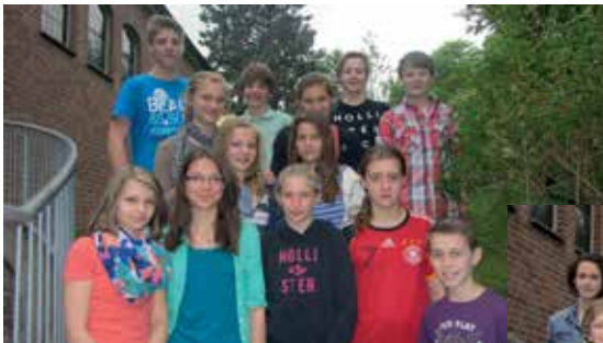
frühe Gruppe ab 16.00 Uhr und